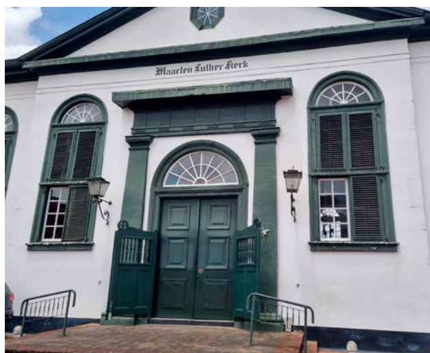
Maarten Lutherkerk, Waterkant, Paramaribo, Suriname