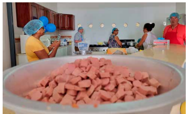
De gaarkeuken in gebruik, tachtig maaltijden in de maak.

Met vijf gemeenten, vier in groot-Paramaribo en één in Nickerie (in vereniging met hervormden) probeert de kerk daar in te springen waar de nood het hoogst is: op straat bij de dak- en thuislozen, maar ook steeds meer achter de voordeur bij 'gewone' middenklassers. Op bezoek bij alle kerken in groot-Paramaribo klinkt het moeilijke dagelijkse leven naast de vreugde van het gemeenschap zijn, mét de betrokkenheid op elkaar. Op straat is de ontmoeting met mensen er een van grote vriendelijkheid, van bereidheid tot gesprek, gemoedelijkheid. Maar het oog kan zich op straat niet onttrekken aan het gebrek aan middelen. Om en om zijn in Paramaribo de panden keurig onderhouden of tot op wiebelende shutters vervallen. Als je door het verval heen kijkt, begrijp je wel waarom de binnenstad van Paramaribo op de lijst van werelderfgoed van UNESCO prijkt. Naar beneden kijken is wel een vereiste, stoepen en straten hebben te lijden aan gebrek aan onderhoud. Overal in de binnenstad liggen mensen op trappen, verdwijnen ze in wegwijnende gebouwen en proberen mensen een paar