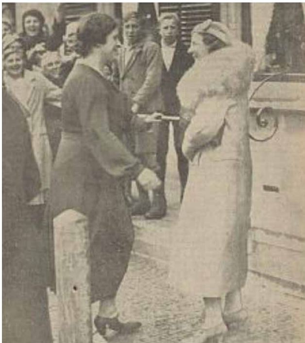
Prinses Juliana bezoekt haar studievriendin in Groede (1934)