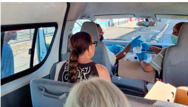
's Morgens, in Paramaribo ontbijt voor dak- en thuislozen.

Voornaamste redenen van vertraging waren de covid-pandemie die Suriname hard heeft getroffen en de almaar slechter wordende economisch-financiële situatie waarin het land verkeert. De deplorabele economische stand van Suriname maakt het des te noodzakelijker dat de keuken van waaruit de meest noodlijdende mensen voorzien kunnen worden van een maaltijd, juist nu is geopend.